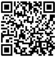
แบบลงทะเบียน

จึงเรียนมาเพื่อโปรดประชาสัมพันธ์งานดังกล่าวให้กับผู้สำเร็จการศึกษาด้วยทุน พสวท. ทราบต่อไปด้วย สสวท. ขอขอบคุณมา ณ โอกาสนี้