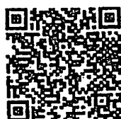
QR Code ลงทะเบียนชำระเงิน

12.2 หลังจากโอนเงินเรียบร้อยแล้วแจ้งรายละเอียดในการออกใบเสร็จให้ชัดเจนพร้อมส่งหลักฐานการชำระเงินผ่านระบบออนไลน์โดยสามารถสแกน QR Code