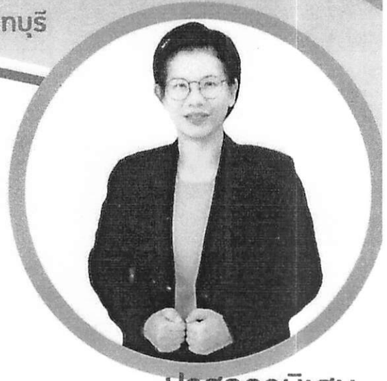
ปาฐกถาพิเศษ

* เอกสารประกอบการประชุม (Proceedings) สามารถดาวน์โหลดได้จากเว็บไซต์ของสถาบันวิจัยและพัฒนาหลังจากจัดงานประชุมฯ ประมาณ 1 เดือน *