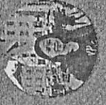
Wanlee Talbakul Chulalongkorn University