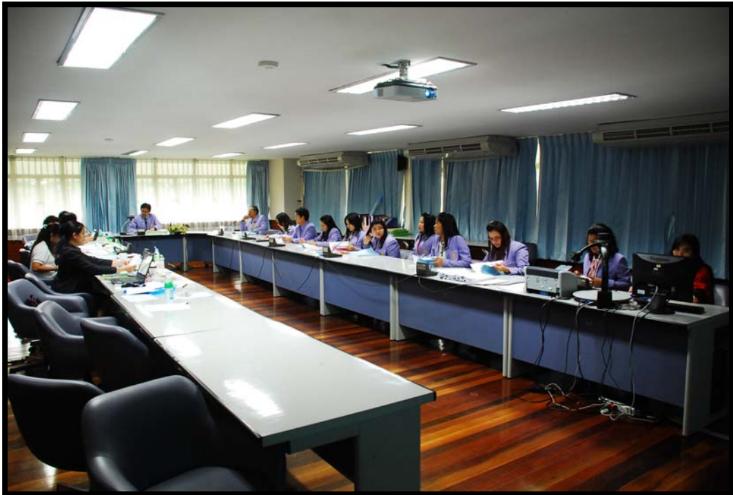
รองคณบดี บัณฑิตวิทยาลัยกล่าวรายงานผลการดำเนินงานบัณฑิตวิทยาลัย