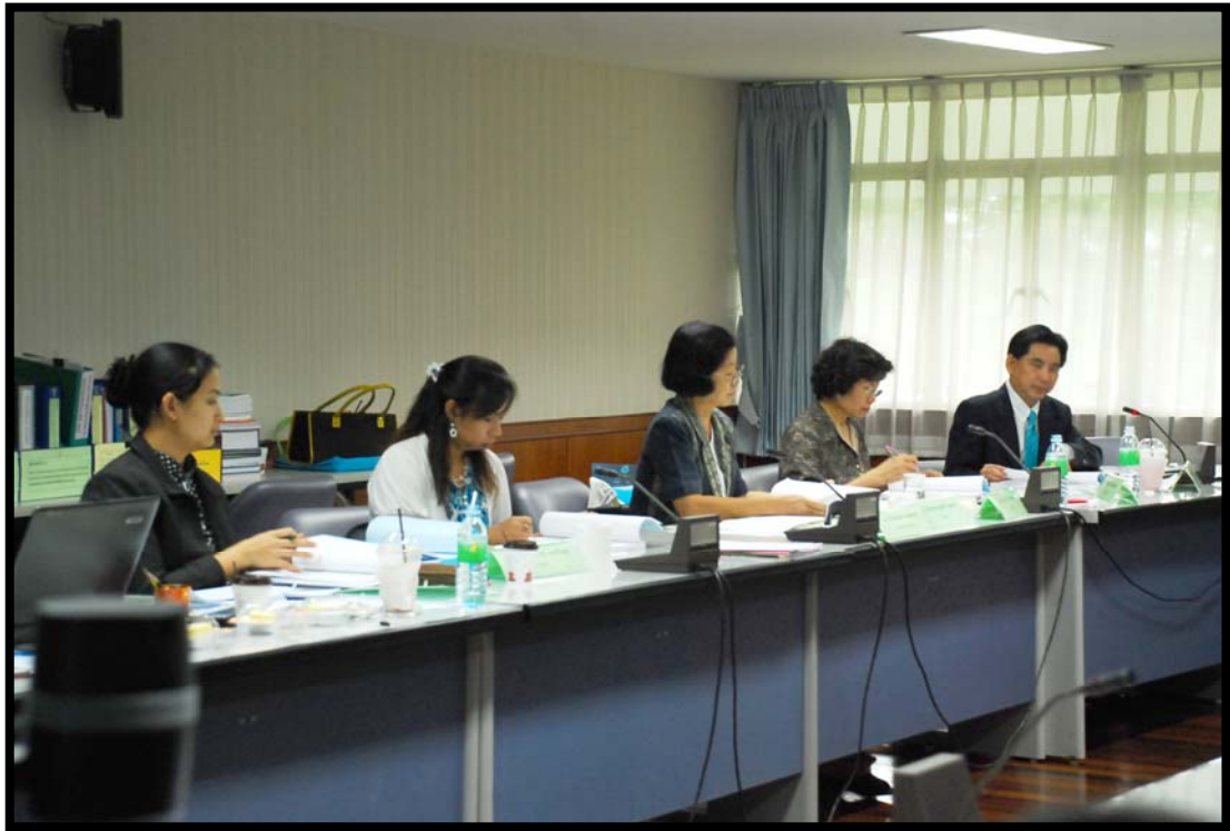
คณะกรรมการตรวจประเมินภายใน