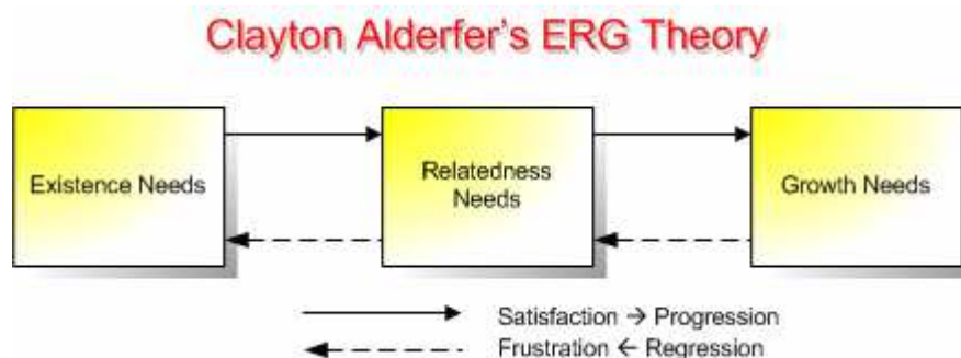
ภาพที่ 2.2: ลำดับความต้องการของมนุษย์ตามแนวคิดของเคลย์ตัน แอลเดอร์เฟอร์